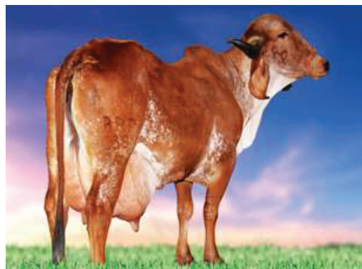
HIRANA FIV BRASILIA - MÃE